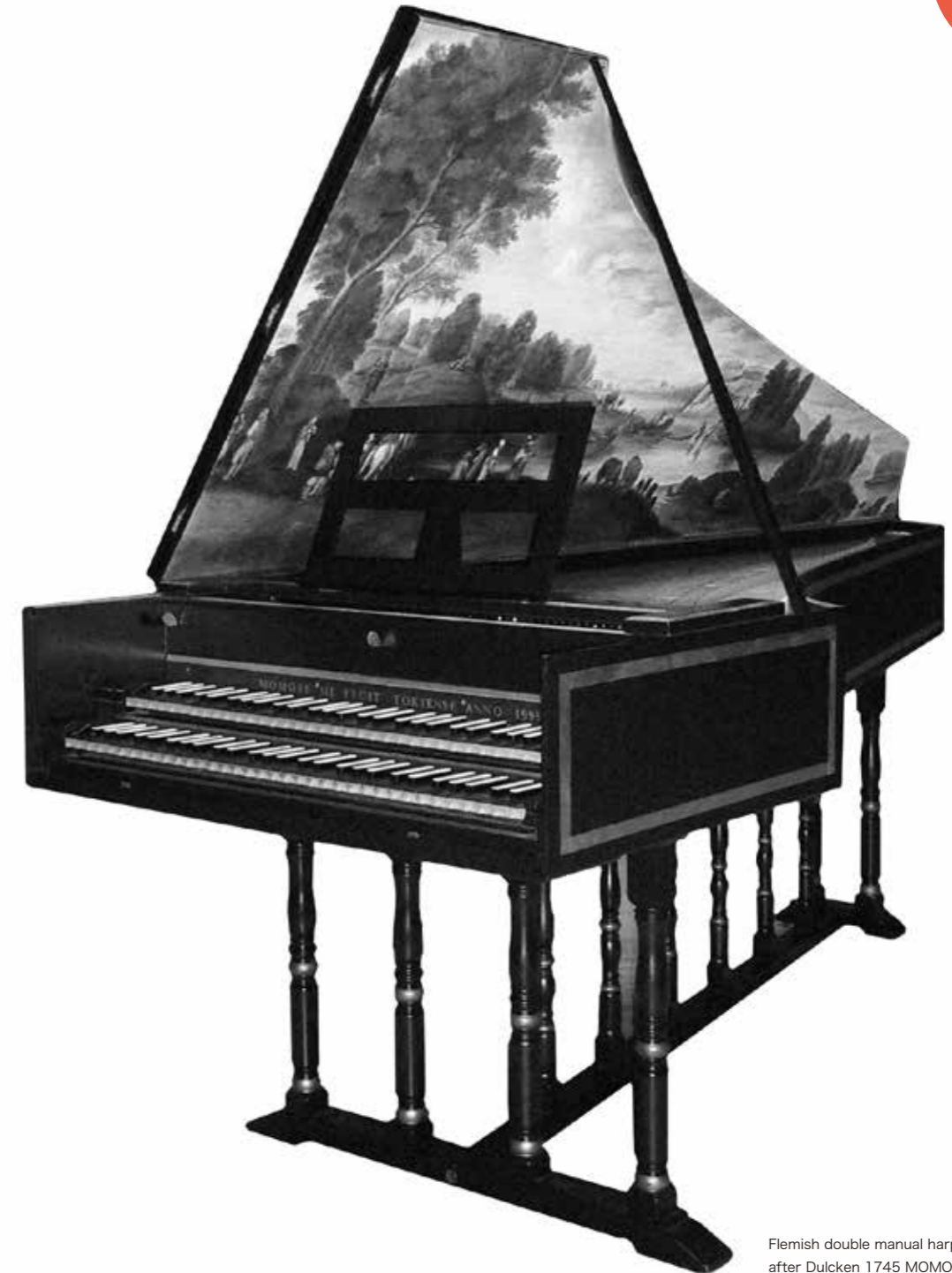
Flemish double manual harpsichord after Dulcken 1745 MOMOSE HARPSICHORD 1995